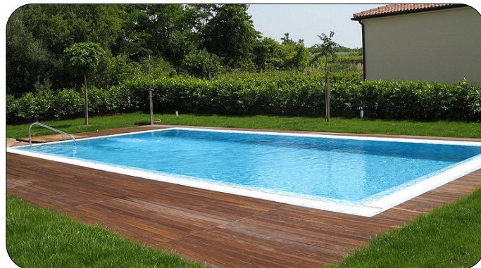
Slike so simbolne.